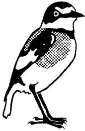
Lanioturdus torquatus Drosselwürger