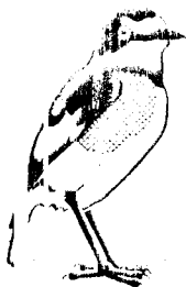
L. ... D. ...