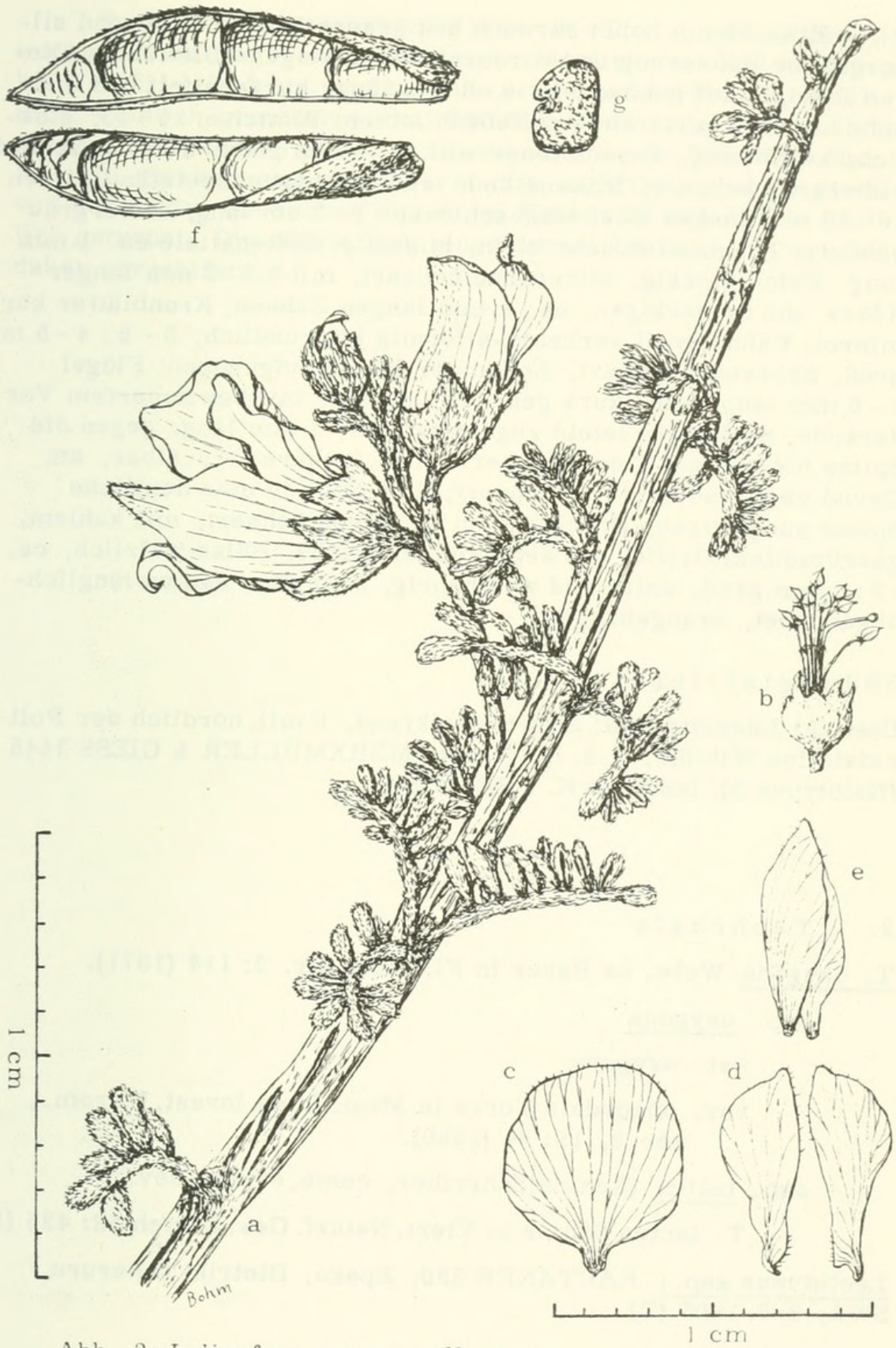
Abb. 3: Indigofera merxmuelleri