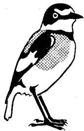
Lamiorurdus torquatus Drosselwürger